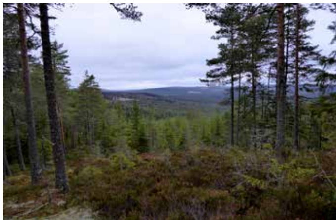
Utsikt från Petter-Nilsberget.

Gör upp eld bara på de iordningställda eldplatserna. Förvissa dig alltid om att elden är släckt innan du går vidare och elda aldrig under sommarens torrperioder då brandfaran är stor.