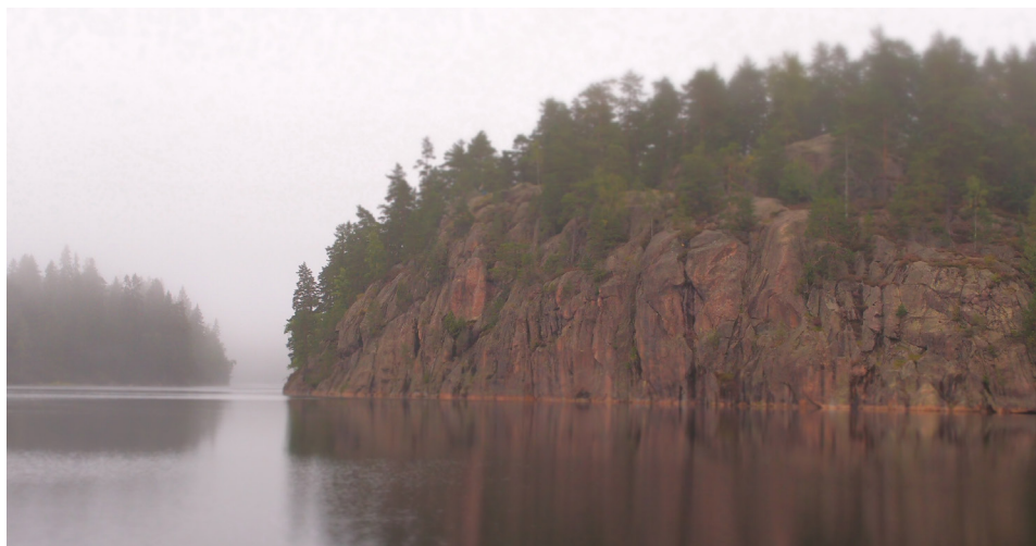
Falkasjön med Falkaberget i bakgrunden